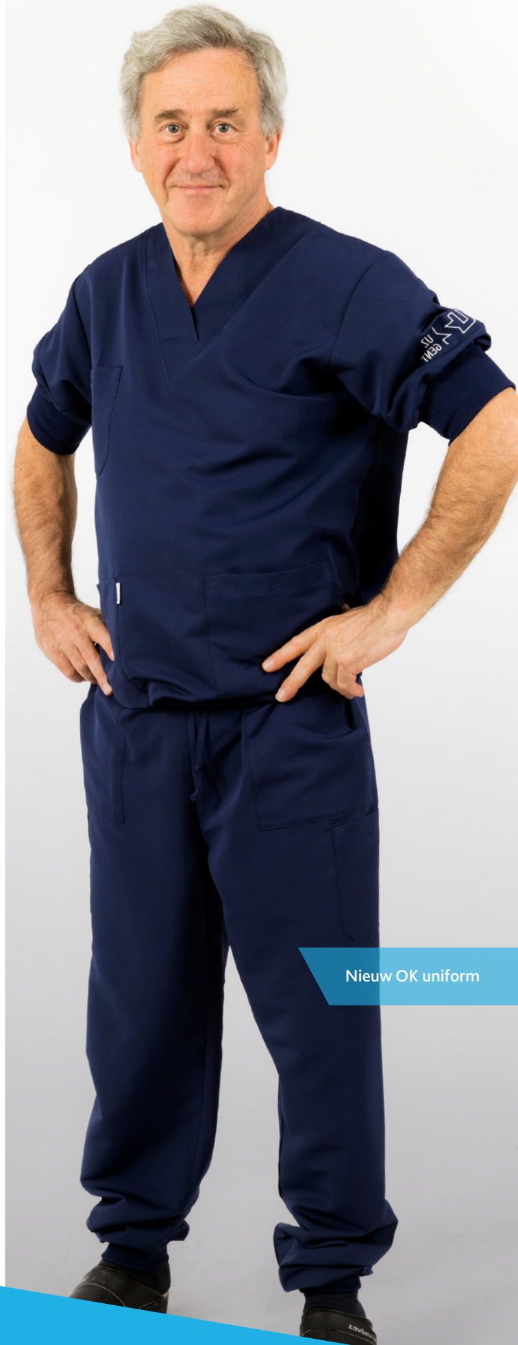
Nieuw OK uniform

Sinds de implementatie heeft het ziekenhuis vastgesteld dat de reacties op de werkkleding over het algemeen positief zijn, en er zijn geen klachten geconstateerd. Ze zijn van plan om de werkkleding in 2028 te evalueren, om te beoordelen of deze nog steeds voldoet aan de vereisten en de tevredenheid van de dragers.